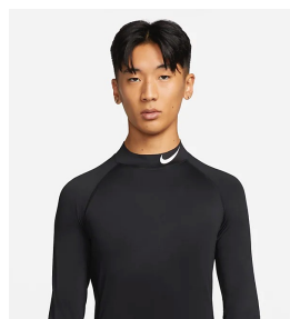
ロゴが入っている