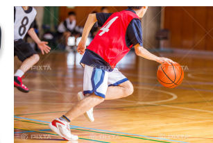
コンプレッション系の ウェアではない