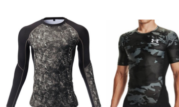
模様がある。単色ではない。