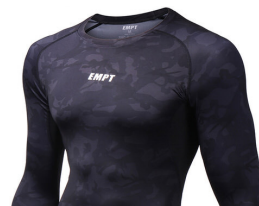
模様があるが 単色と認定できる