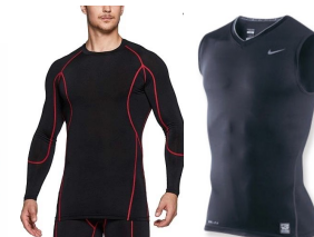
ラインに同系色では 無い色がついてる